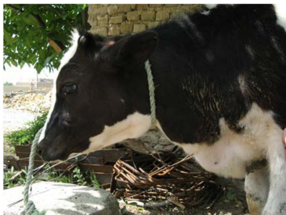
تصویر ۱- ادم ناحیه بریسکت و قسمت شکمی فک پایین

کورپولمونال شکل ثانویه‌ای از بیماری قلبی بوده که ویژگی اساسی آن افزایش فشار خون ریوی می‌باشد. این عارضه منجر به هیپرتروفی، اتساع و نارسایی قلب راست می‌شود. شایع‌ترین عامل وقوع کورپولمونال، بیماری کوه‌های مرتفع (High Mountain Disease) بوده و در گاوهای که در ارتفاع بیش از ۱۶۰۰ متری نگهداری می‌شوند اتفاق می‌افتد. در این بیماری به منظور حفظ فشار اکسیژن، عروق ریوی منقبض گردیده که نتیجه آن افزایش فشار خون در این عروق می‌باشد. افزایش فشار خون ریوی، در نهایت منجر به افزایش بارکاری قلب راست و به دنبال آن ادم و آسیت می‌گردد (۷، ۴). برونکوپنومونی گوساله‌ها یکی از مهمترین عوامل تلفات و بیماری‌های تاثیرگذار بر رشد و آینده اقتصادی گوساله‌ها بوده که می‌تواند از جمله علل بروز کورپولمونال محسوب شود.